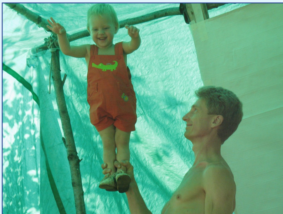
ФОТО НА МИЛЛИОН